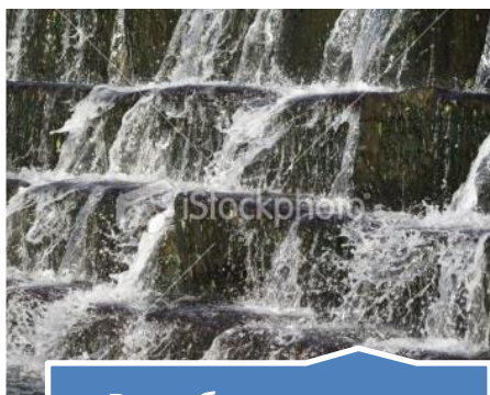
Возобновляемые источники энергии