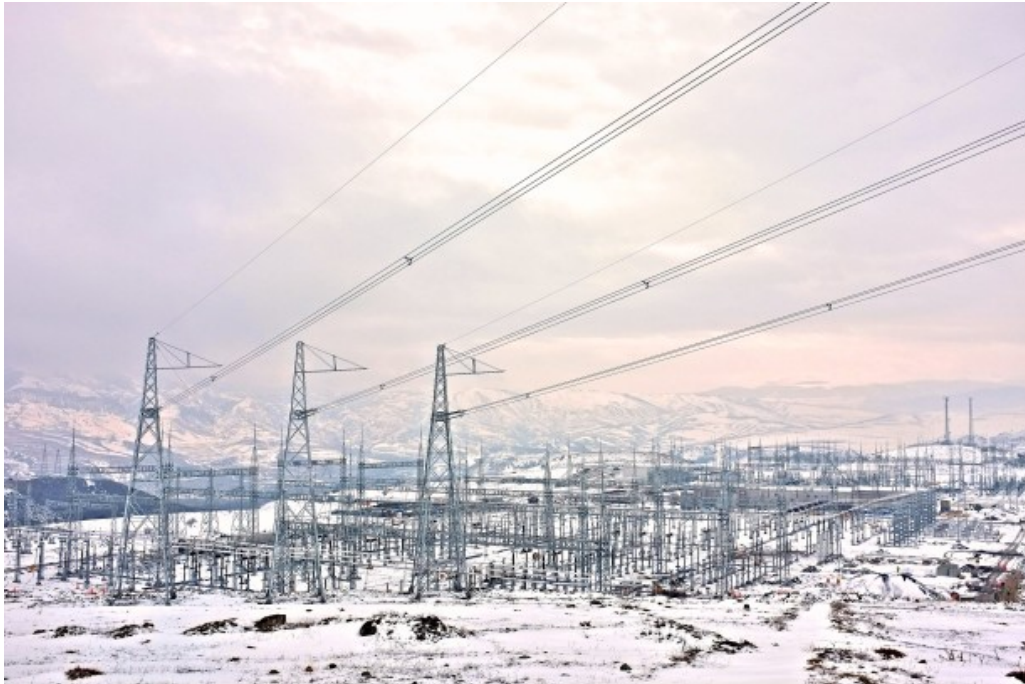
Новый трансформаторная подстанция.